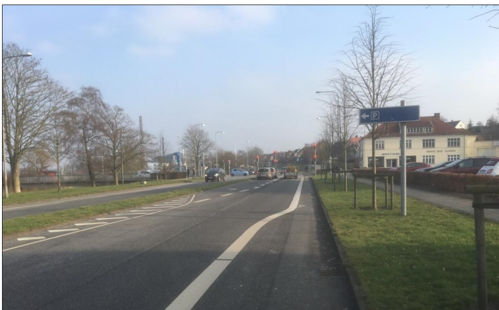
17. februar 2019

Selvom cykelbanen er ret smal på det sidste stykke frem mod krydset, er det en klar forbedring for cyklister, at der nu er en fuldt optrukket linje helt frem mod krydset ved Hertug Hans Bro.