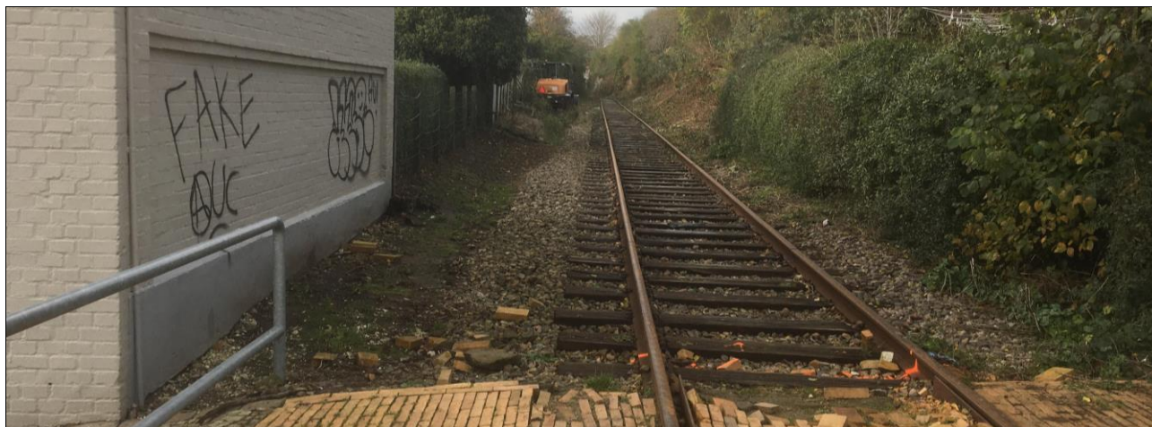
Ved Pladsgade 8. november 2019

Og så serverer vi forresten i aftenens løb kaffe/te og lidt sødt!