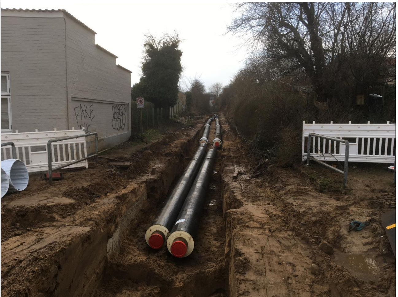
Ved Pladsgade 10. februar 2020