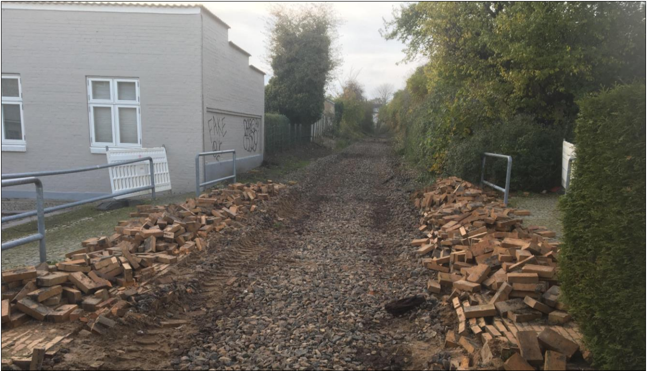
Ved Pladsgade 11. november 2019