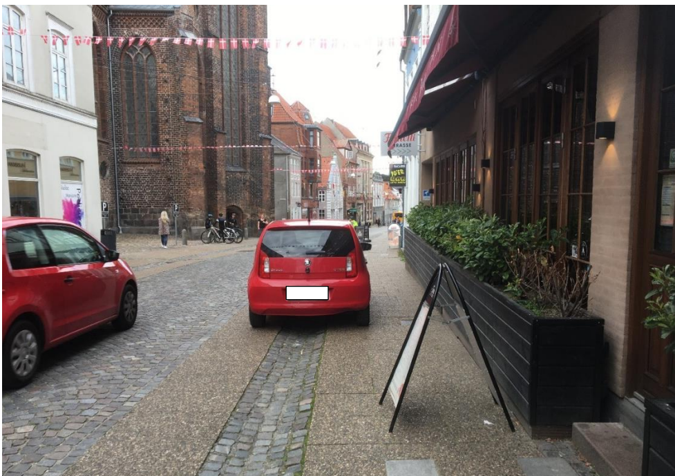
Nørregade 28.8.21, kl. 17.50

JyskeVestkysten har strammet lidt op på vores indlæg i overskriften til en stor artikel om Nørregade. Vi har blot peget på, at hvis ønsket er fartdæmpning og mindre biltrafik i Nørregade, skal man ikke forvente det realiseret ved at ensrette biltrafikken. Der skal mere til.