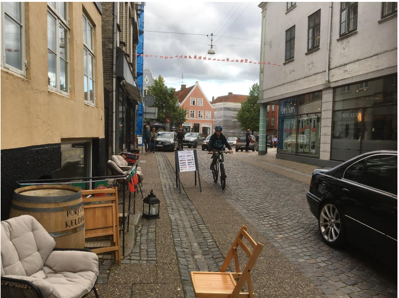
Nørregade 28.8.21, kl. 17.49

Husk medlemsmøde og generalforsamling 12. oktober kl. 19.30 på Bispen!