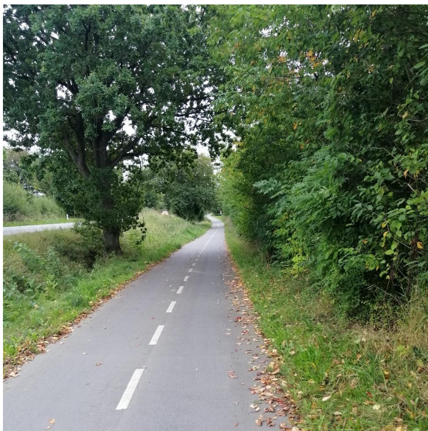
september 2021