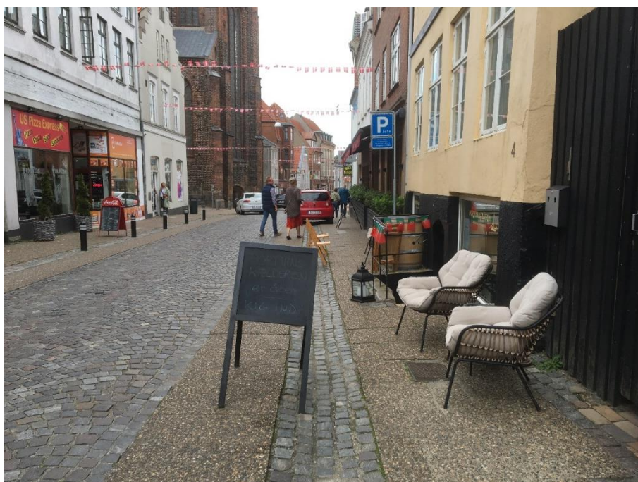
Nørregade 28.8.21, kl. 17.49