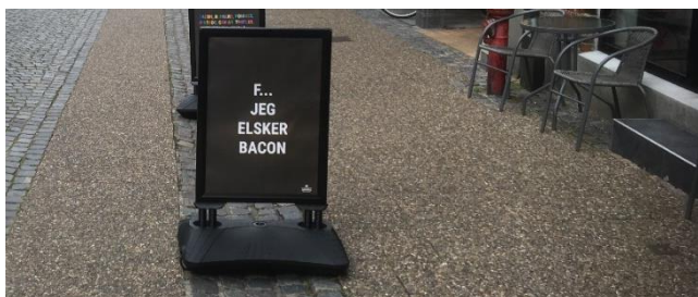
Nørregade 28.8.21, kl. 17.48

Vi vil selvfølgelig også tage Nørregade op på Medlemsmødet d. 12.10., men svarfristen kan ligge så tæt på medlemsmødet, at vi gerne vil ha' kommentarer forud for mødet.