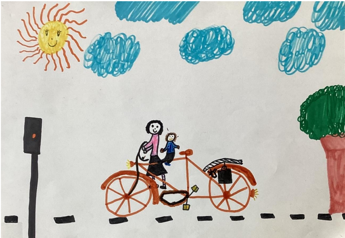
Tegning: Birgitte L. Hansen til en udstilling i Aktivitetshuset 1983