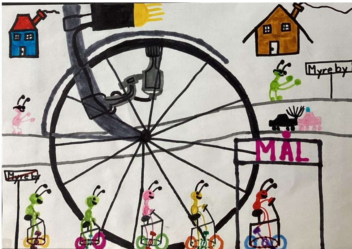
Tegning: Jesper Kelsen til en udstilling i Aktivitetshuset 1983