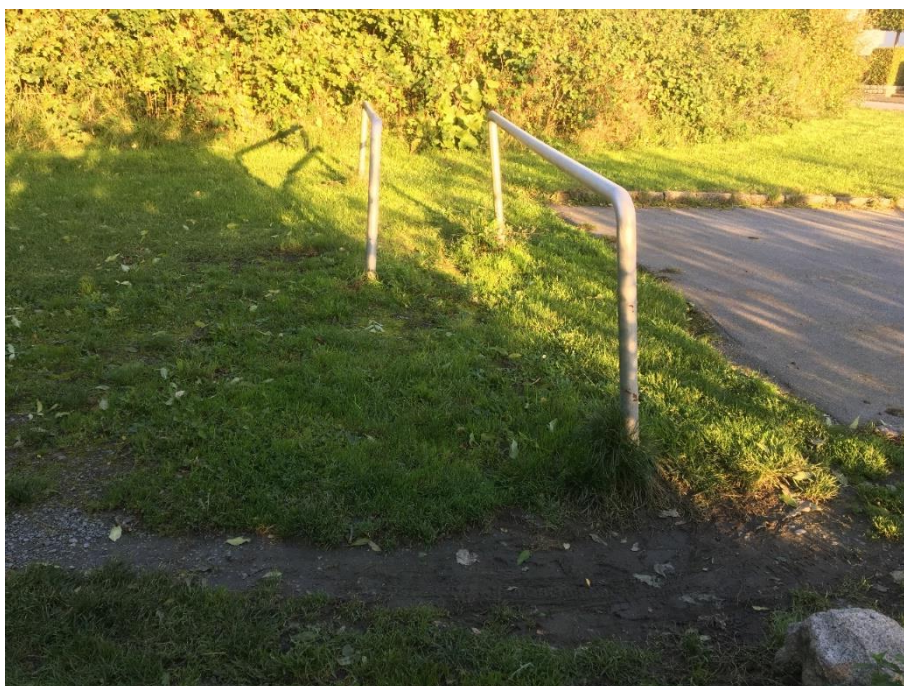
Haderslev, efterår 2021