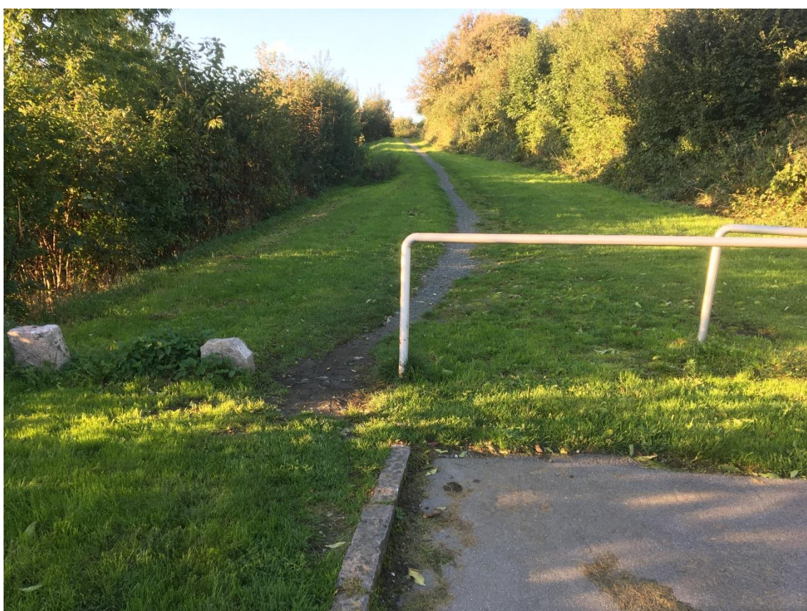
Haderslev, efterår 2021