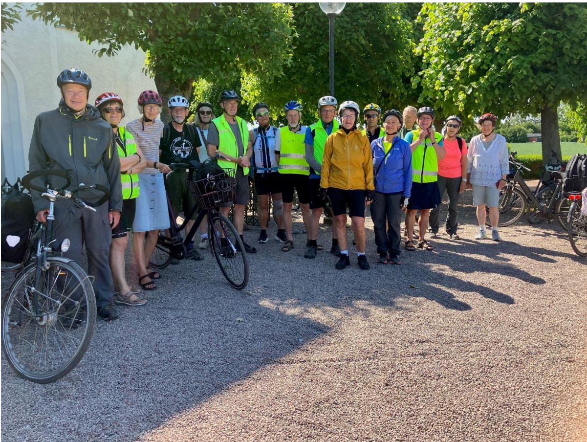
Landskrona og Hven

17 medlemmer fra formiddagsholdene, der cykler fra henholdsvis Hestetorvet og Trekroner, deltog i dagene 7. – 9. juni i en mini ferie til Landskrona og Hven.