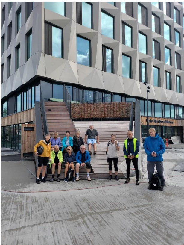
På cykeltur med Trekronerholdet

Torsdag kl. 10 i ulige uger mødes deltagerne på Trekronerholdet til en cykeltur med start fra Café Korn i Trekroner. En turleder har planlagt en tur på ca. 30 km. Turene går ud i naturen, og undervejs holder vi en kaffepause og en frokostpause. I denne sæson har der foreløbig været 8 fra holdet, der har været turledere.