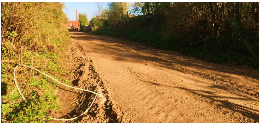
18.4.2020 Nej! Nu er der ledninger til lamperne