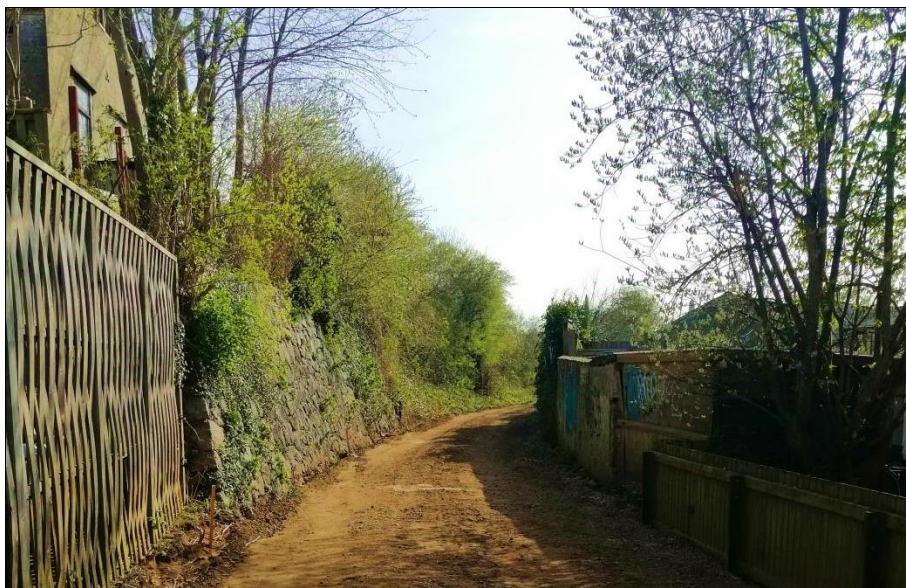
12.4.2020 Er arbejdet gået i stå?