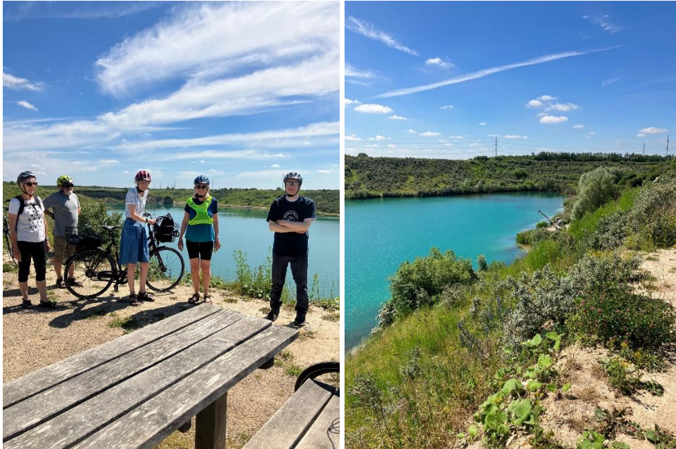
På cykeltur med Trekronerholdet, her til Lynghøjsøerne.

Torsdag kl. 10 i ulige uger mødes glade og forventningsfulde cyklister til en cykeltur med start fra Cafe Korn i Trekroner. En turlleder har planlagt en tur på ca. 30 km. Turene går ud i naturen, og undervejs holder vi en kaffepause og en frokostpause.