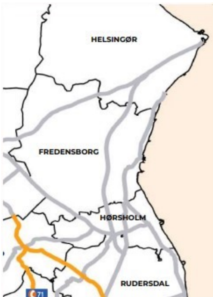
Kort fra Visionsplanen 2045

David Gaardsdal Rønnov gennemgik de relevante ruter i Nordsjælland, og fortalte om udfordringerne med kvaliteten af nogen af de eksisterende stier, hvilket forsamlingen godt kunne genkende og bidrage med viden om.