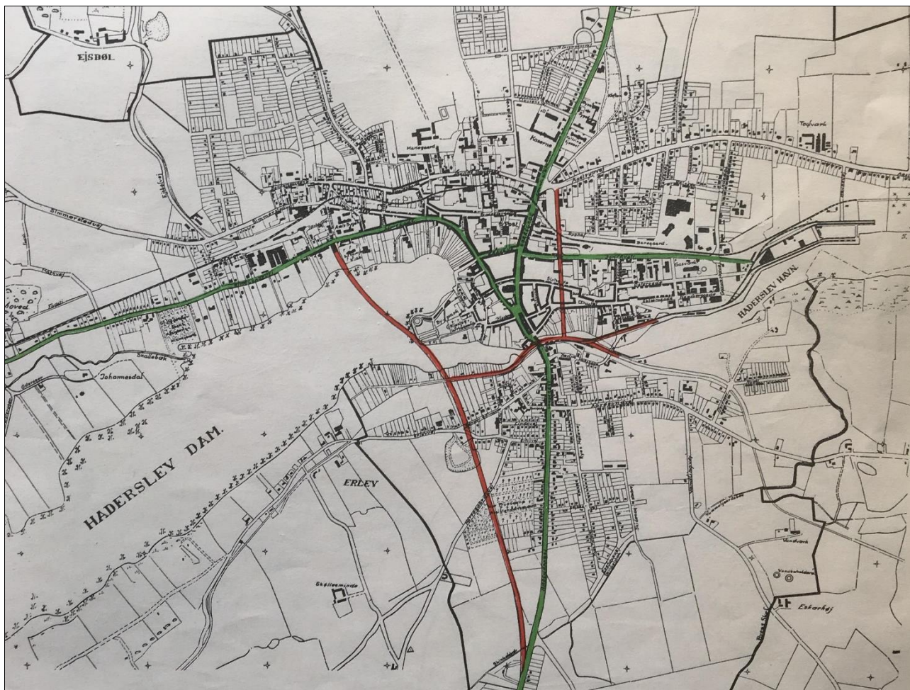
Fra "De nye Vejlinier i Haderslev Købstad. En Redegørelse fra Byraadets Medlemmer", 1946

Derefter i årevis diskussion om linjeføring for en egentlig omkørselsvej vest eller øst om bykernen.