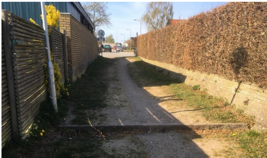
Bumpet set mod Rugager